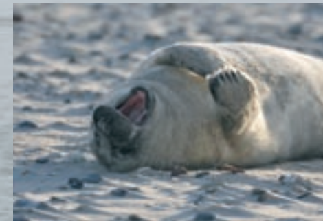
4 Junge Kegelrobbe

Kegelrobbenbabies kommen im Winter zur Welt, Seehunde werden im Sommer geboren. Trotzdem brauchen beide eine dicke Speckschicht, um im Wasser nicht auszukühlen. Die Milch der Muttertiere hat ca. 50% Fettanteil, damit kann ein Jungtier schnell Gewicht gewinnen. Auch für den Zeitraum, in dem sie lernen, selbst erfolgreich zu jagen, brauchen sie eine Reserve. Neugeborene Schweinswale werden ebenfalls gesäugt. Das erledigen Mutter und Kalb allerdings unter Wasser und nicht wie Seehunde und Kegelrobben auf der Sandbank oder am Strand.